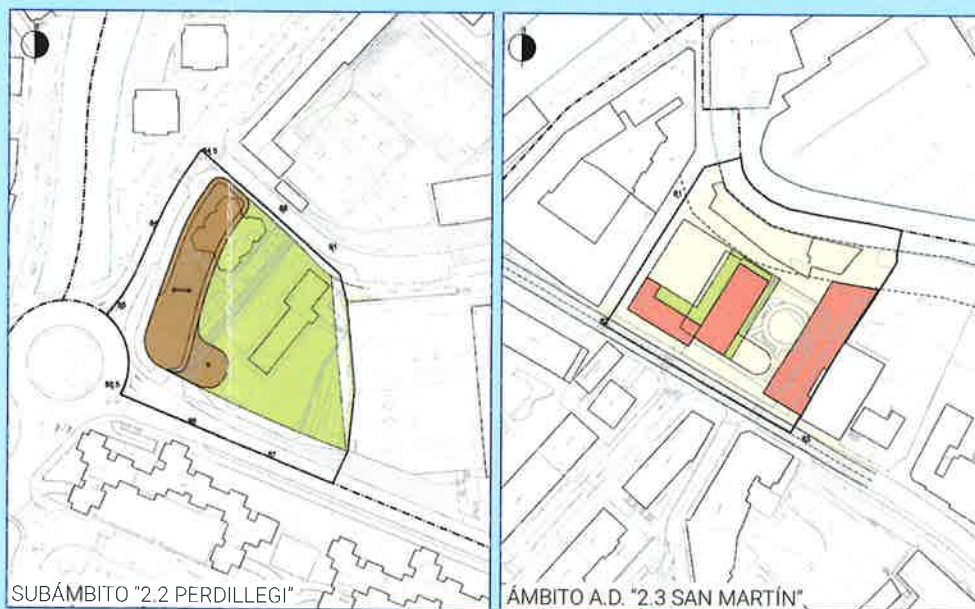
"1" alternatibaren ordenazio planta

Udalaren helburuari ez dio erantzuten. Hurrengo irudian dago jasota.