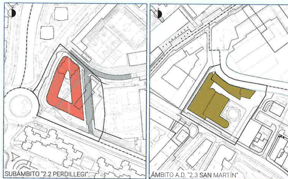
"0" alternatibaren ordenazio planta

Helburu horri erantzuten dioten bi alternatiba (1 eta 2) planteatu dira xede horretarako. 1. alternatiban, Perdillegi azpierzara ekipamendutarako erabiliko da oso-osorik; 2. alternatiban, berriz, zati bat bizitegitarako ere erabiliko da. Hala, 1. alternatiban, erabilera nagusia bizitegi-erabilera izango duten 7.200 m2(s) antolatzea proposatzen da; 2. alternatiban, berriz, indarreko HAPON aurreikusitako 13.000 m2(s)-ko eraikigarritasun osoa mantenduko da, Perdillegi eta San Martín azpierzara erabiltzeko moduan. Kasu batean zein bestean, bi azpierzara hiri-lurzuaren sailkapenarekin jarraituko da. Ondoriozko bizitegitarako hirigintza-eraikigarritasuna txikiagoa da 1. alternatiban baino, kasu horretan, handitu egin da adineko pertsonak bizitegi-ekipamenduari lotutako partzelaren neurria.