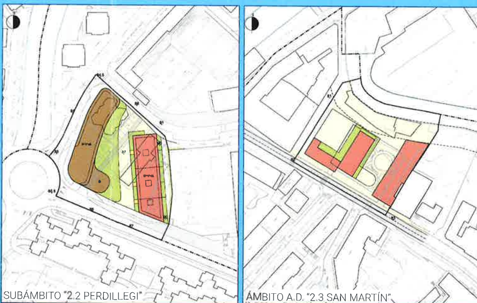
"2" alternatibaren ordenazio planta

Planteaturako helburu bikoitzari erantzuten dion alternatiba da. Horretarako, dimentsio bereziko zuzkidura-partzela bat eskaintzen du, baina HAPON hasiera batean aurreikusitako bizitegi-eraikigarritasuna murriztuz. Hurrengo irudian dago jasota.