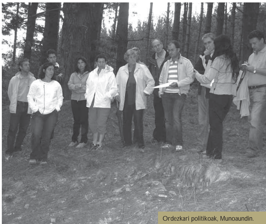
Ordezkarri politikoak, Munoaundin.

Gipuzkoako Foru Aldundiko Kultura ardurandunek eta Azpeitiko eta Azkoitiko alkateak indusketa arkeologikoan izan dira bisitan.