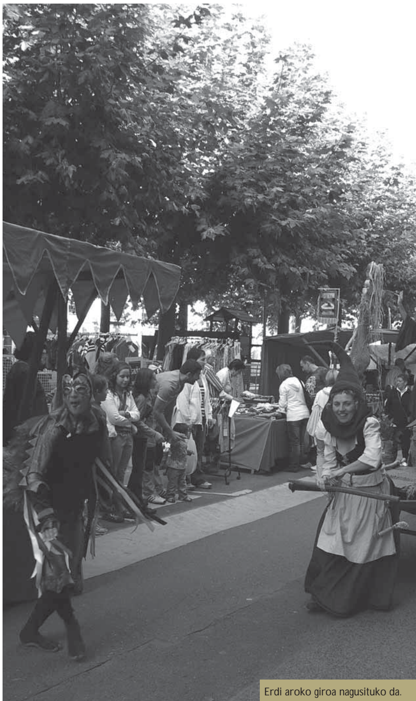
Erdi aroko giroa nagusituko da.

Udalak herritarrak parte hartzera animatu nahi ditu. Jada tradizio bihurtzen ari den azokaren bueltan sortuko den giroaz gozatzeko aukera paregabea izango da.