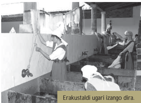
Erakustaldi ugari izango dira.

Herriko dendariak Stock azoka jarriko dute iraileko azken asteburuko ekitaldian