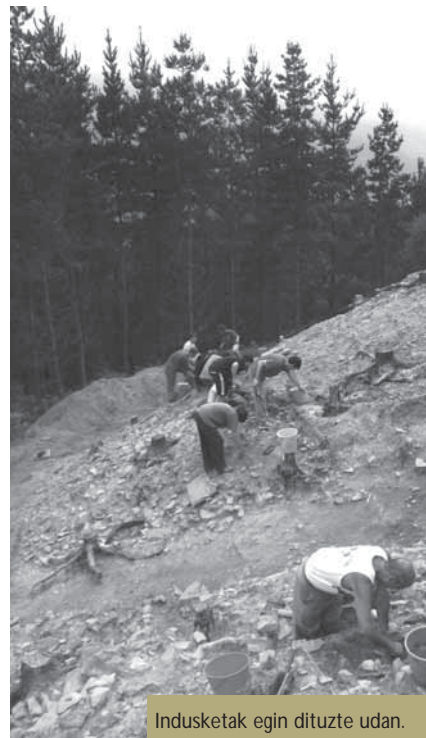
Indusketak egin dituzte udan.

m unoaundiko Burdin aroko herri harresituan udan egindako lanak bertatik bertara ezagutu dituzte Foru Aldundiko eta Azpeitiko eta Azkoitiko udal ordezkariak. Indusketaren IV. kanpaina amaitu berria da, eta inguruko eta kanpoko langile asko aritu da bertan lanean. Lanen martxaren berri izan dute ordezkari politikoak.