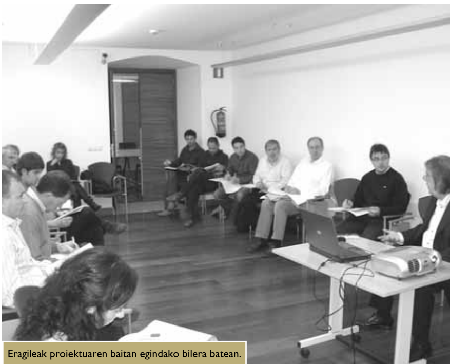
Eragileak proiektuaren baitan egindako bilera batean.

Iraurgi Lantzen eta Mondragon Unibertsitateak sustatutako ekimenak Azpeitia eta Azkoitiko eragileak biltzen ditu.