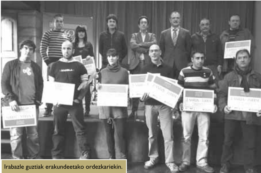
Irabazle guztiak erakundeetako ordezkariekin.

URKOME elkarteak jarduera berritzaileak bultzatzen dituen proiektuak saritu zituen Enparan Dorretxean egindako ekitaldian