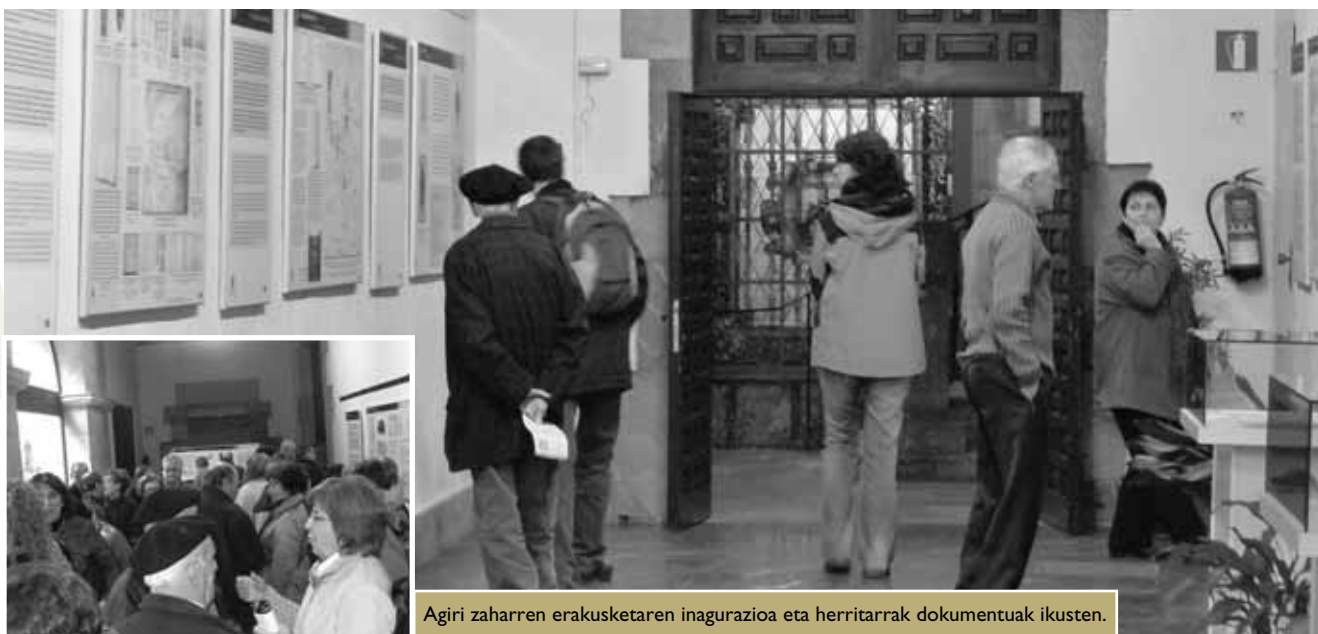
Agiri zaharren erakusketaren inagurazioa eta herritarrek dokumentuak ikusten.

Martxoan, urteurrenarekin lotutako mahai-ingurua eta hitzaldia izango dira.