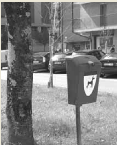
Txakur-kakak botatzeko ontzi berezi bat.

a zken aldian Azpeitiko eta Azkoitiko udaletan txakur-kakak ez jasotzeagatik iritsi diren kexen aurrean kezkatuta, bi herrietako ordezkariak bat egin dute kale eta berdeguneak txukun eta garbi mantentzeko asmoz.