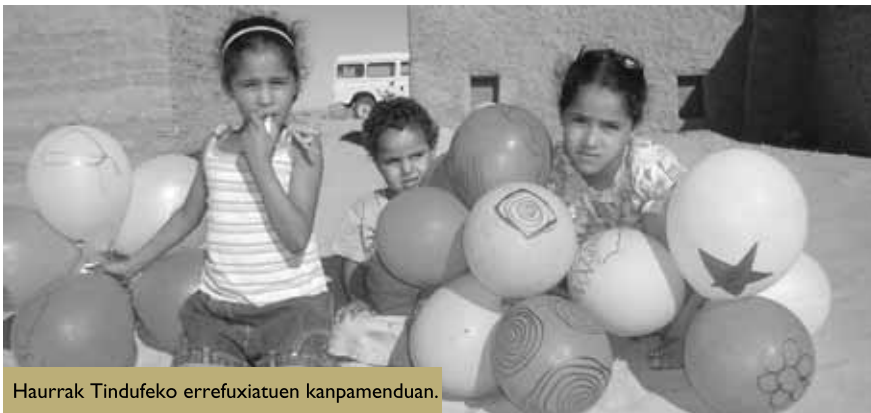
Haurrak Tindufeko errefuxiatuen kanpamentuan.

Oporrak Bakean programan parte hartzeko maiatzaren 14a baino lehen eman behar da izena