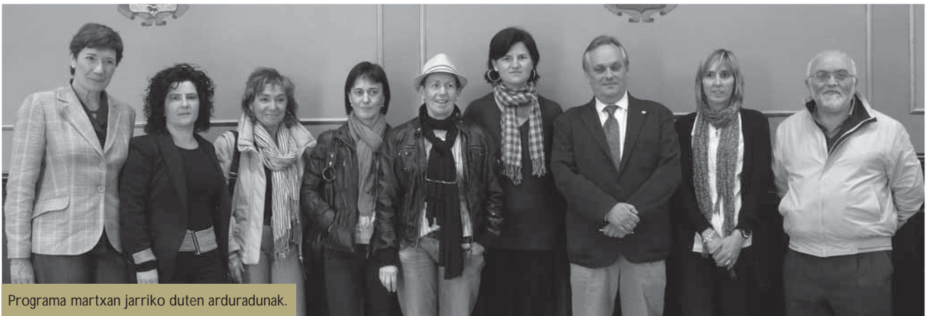
Programa martxan jarriko duten arduradunak.

Azpeitian gaur egun 105 dira Gizarte Zerbitzuetako laguntza jasotzen duten familiak