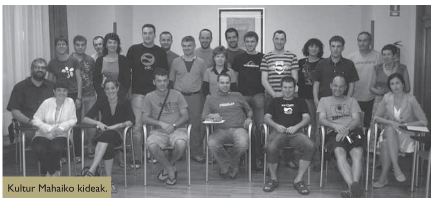
Kultur Mahaiko kideak.

a zpeitiko Udala ahaleginetan ari da San Agustín kulturgunea San Inazio festetako inauguratzeko. Eraikinaren eraberritze lan guztiak amaituta daude dagoeneko baina barrua ekipatzeko beharrezkoa den proiektua (sonorizazioa, argiztapena eta multimedia materiala) onartzea falta zen eta azken egunotan Espainiako Etxebizitza Ministerioak dirua libratzeko azken dokumentua berehala sinatuko duela jakinarazi du. Honela, 300.000 euroak kulturgunea amaitzeko bideratuko dira eta lan hauek bi hilabeteko iraupena izango dute.