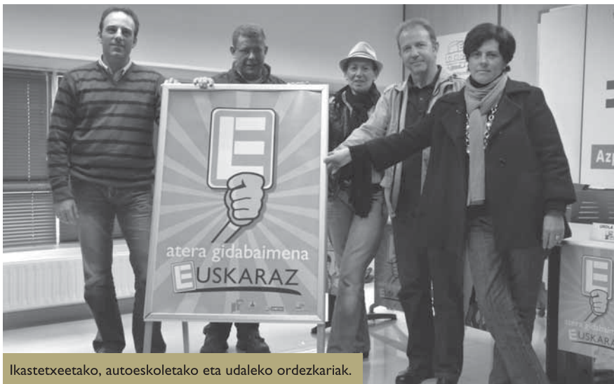
Ikastetxeetako, autoeskoletako eta udaleko ordezkariak.

Arduradunek sariak emango dizkiete euskaraz ateratzen duten lehenengo 10 ikasleei