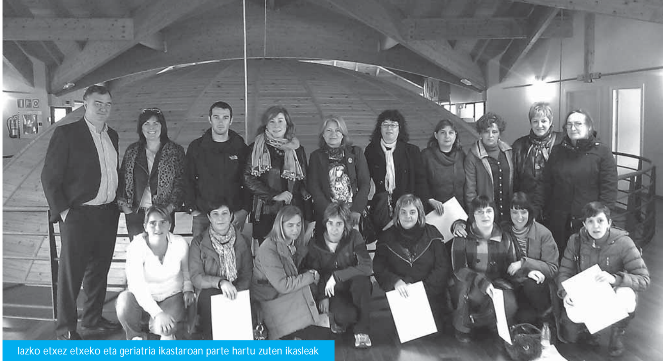
lazko etxez etxeko eta geriatría ikastaroan parte hartu zuten ikasleak