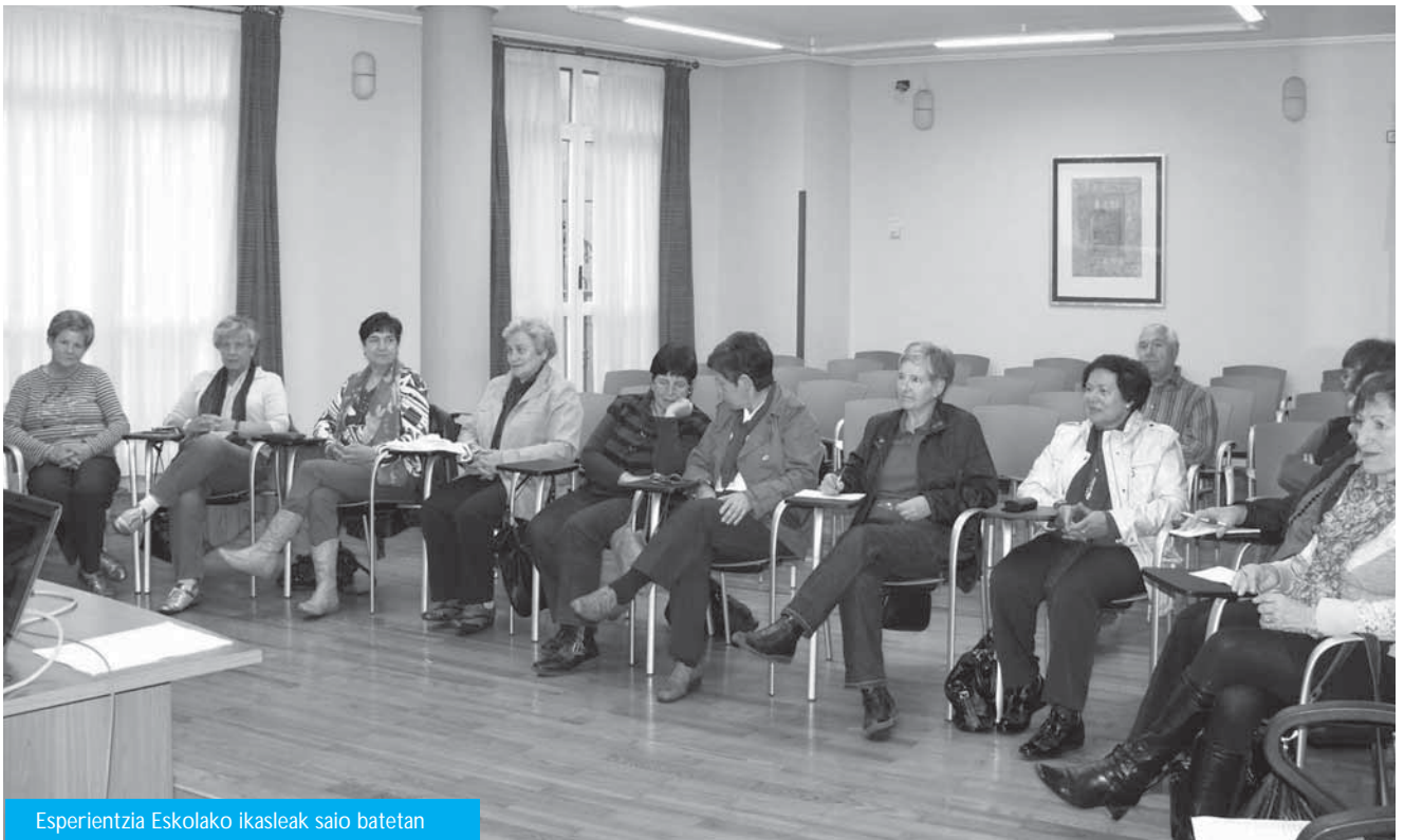
Esperientzia Eskolako ikasleak saio batetan

Horrela, etengabeko ikaskuntza proiektua martxan jartzea da asmoa, parte-hartze aktibo bidez, 50 urtetik gorakoek boluntariorantzako helburuarekin.