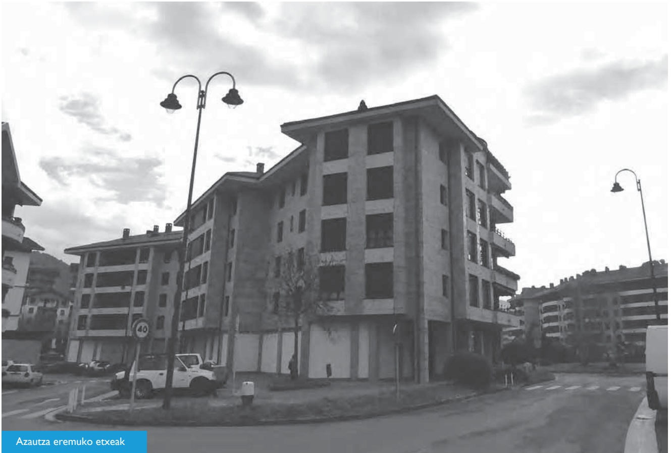
Azautza eremuko etxeak