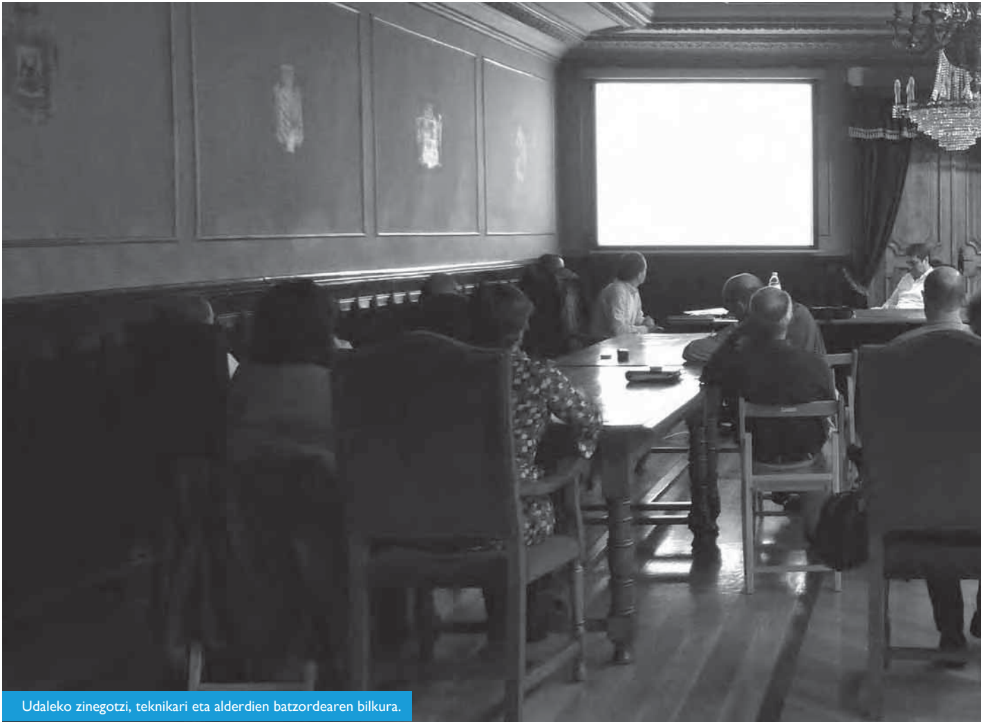
Udaleko zinegotzi, teknikari eta alderdien batzordearen bilkura.